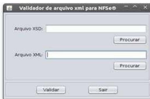
Figura 3: Tela inicial do Validador

No campo “Arquivo XSD” pode ser especificado o arquivo contendo o XML Schema a ser utilizado na validação. Para validar o XML Schema do sistema de DMST-e deve ser indicado o arquivo “SchemaDMSeTomadosCaxias.xsd”, que se encontra na pasta da própria aplicação. No campo “Arquivo XML” deve ser indicado o XML a ser validado.