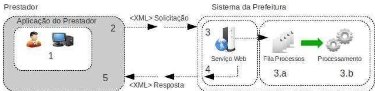
Figura 2: Fluxo de serviço Web assíncrono

As solicitações de serviços de implementação assíncrona são processadas de forma distribuída por vários processos e o resultado do processamento somente é obtido na segunda conexão. Na Figura 2 a seguir tem-se o fluxo simplificado de funcionamento: